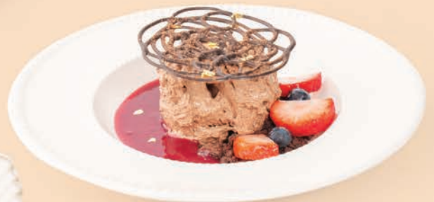
Pineapple Turnover Puff & Vanilla Ice Cream

แป้งพัฟสอดไส้คาราเมลสับประรด และไอศกรีมวานิลลา