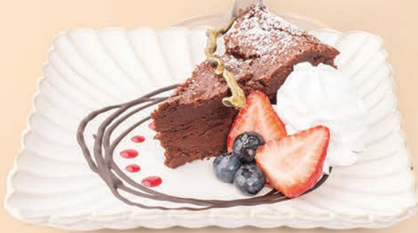
Flourless Chocolate Cake (healthy option)