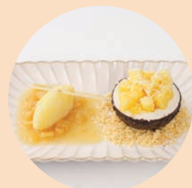
Piña Colada served with Coconut Ice Cream