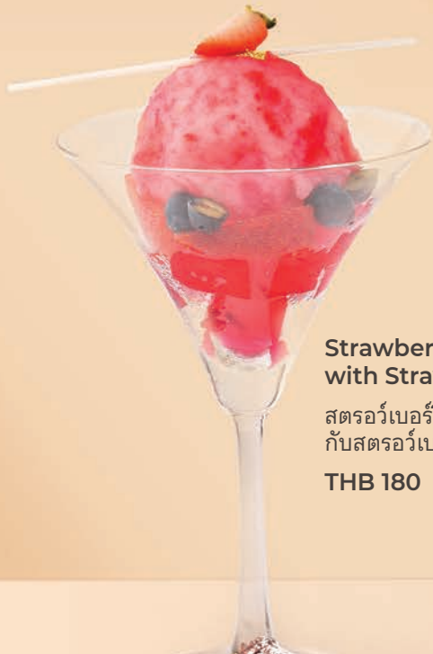
Strawberry Sorbet with Strawberry Jelly

สตรอว์เบอร์รีซอร์เบต กับสตรอว์เบอร์รีเจลลี่