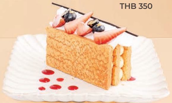
Chocolate Mousse with Raspberry Sauce