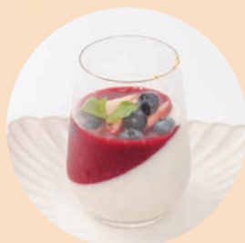
Raspberry Panna Cotta (healthy option)