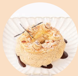
Hazelnut Mascarpone Choux